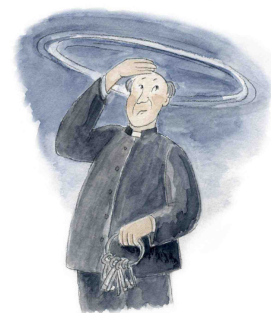
Bild: Hanjo Winkler, DIE ZWEI-QUELLEN-OASE; Kinderteil: Bild und Text: Anna Zeis-Ziegler in: Pfarrbriefservice.de

Am Ende fand sich ein guter Kompromiss: Die Scheinwerfer sollten künftig nur zu besonderen Anlässen eingeschaltet werden – etwa an hohen Feiertagen oder zu besonderen Veranstaltungen. Und im Gemeindebrief wurde ein Beitrag über die Hufeisennasen veröffentlicht. So wurde aus der ehrwürdigen alten Kirche ein neuer Schutzraum für eine bedrohte Art.