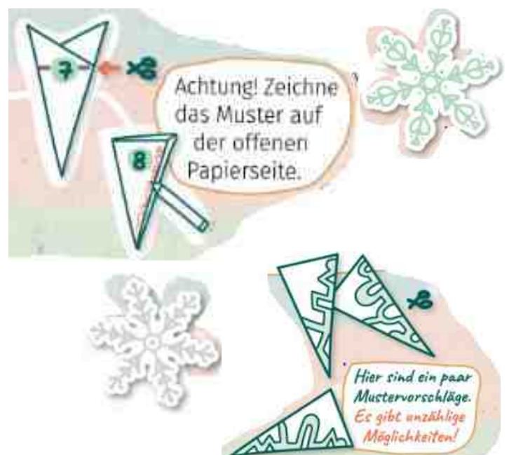
Engeltex: nach Isolde Lachmann, Kinderteil: www.GemeindebriefHelfer.de