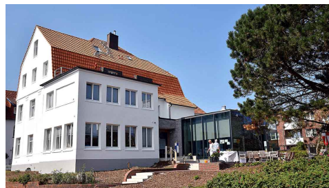
Haus Ansgar

Abreise (11.30 Uhr Fähre W'oooge-Harlesiel)